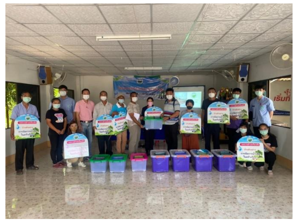
กิจกรรมลงพื้นที่ติดตั้งถังดักไขมันในครัวเรือน